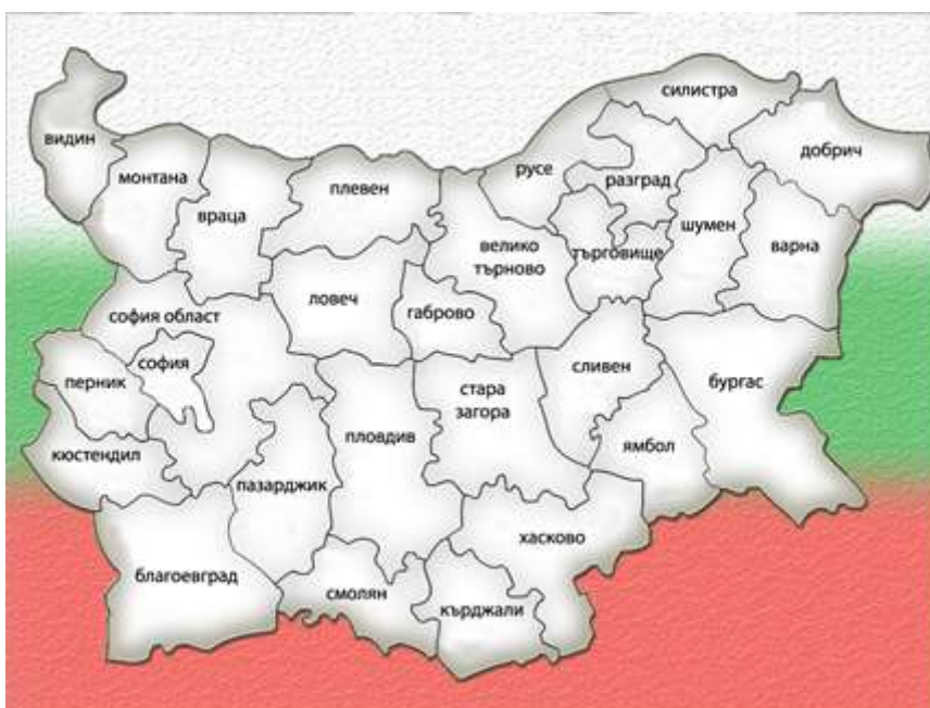
Административна карта на РБългария

Пазарджишка област е разположена в западната част на Горнотракийската низина, на площ 636,722 км 2 , което представлява около 4% от общата площ на страната.